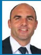
Laurent Favre Conseiller national

INFO ▶ Tout le monde perçoit le paysage différemment. Dans le canton de Neuchâtel, tous les paysages sont influencés par l'action humaine, par exemple à travers l'agriculture, les habitations, les routes, les infrastructures de tourisme, etc. Les éoliennes modifient le paysage de manière réversible. Les routes d'accès nécessaires à leur mise en place peuvent être supprimées et les installations démontées très facilement. Il ne faut pas non plus oublier que toute production d'énergie a un impact sur le paysage !