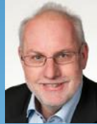
Didier Berberat Conseiller aux États

« Développer l'exploitation durable et réduire le gaspillage - voilà comment gérer notre avenir énergétique ! »